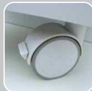
PP KOTAČIĆ SA KOČNICOM