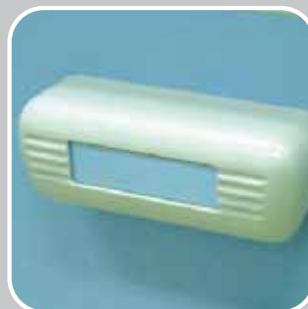
PP PRIHVATNIK SA IDENTIFIKACIJSKIM OTVOROM