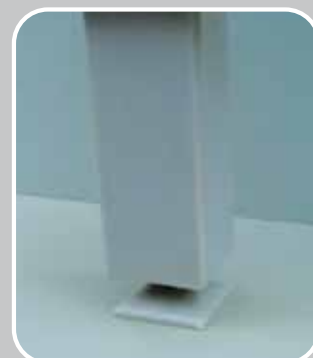
PP NOGICA: velike nosivosti, mehanički PH otporne, podesive po visini